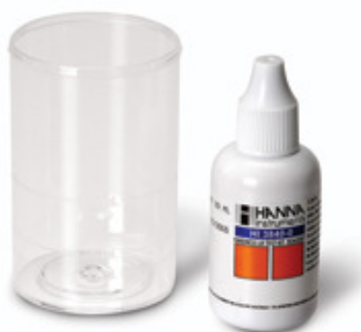
cod TIPH210; TIJH211; TIFH212